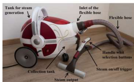
Figure 1. The vacuum cleaner equipped with a dry steam generator used in this study.

In questo studio è stato utilizzato un'aspirapolvere portatile professionale dotato di generatore di vapore secco (Gioel G400, Gioel S.p.A, Trento, Italia). Combina l'aspirazione con il rilascio di vapore ad alta pressione per pulire e igienizzare pavimenti e superfici a frequente contatto umano. La figura 1 mostra i principali componenti del sistema di pulizia, il cui utilizzo richiede alcuni semplici passaggi. Per prima cosa viene riempita con dell'acqua una vaschetta di raccolta, dove lo sporco viene aspirato e depositato. In secondo luogo viene riempito il serbatoio di ricarica del generatore di vapore con acqua, che viene pompata all'interno della caldaia, dove viene riscaldata tramite una resistenza elettrica fino a 155° C, ad una pressione di 5,5 bar, condizioni che generano un vapore secco. Terzo, il tubo flessibile è collegato al corpo macchina e permette le funzioni di aspirazione e/o vapore selezionabili premendo i pulsanti sull'impugnatura. Infine è possibile attivare l'erogazione del vapore secco premendo il grilletto sull'impugnatura.